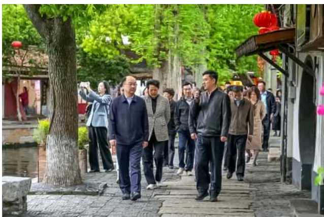
4月16日上午，市人大代表青浦小组走进朱家角古镇，实地考察古镇品质提升成效