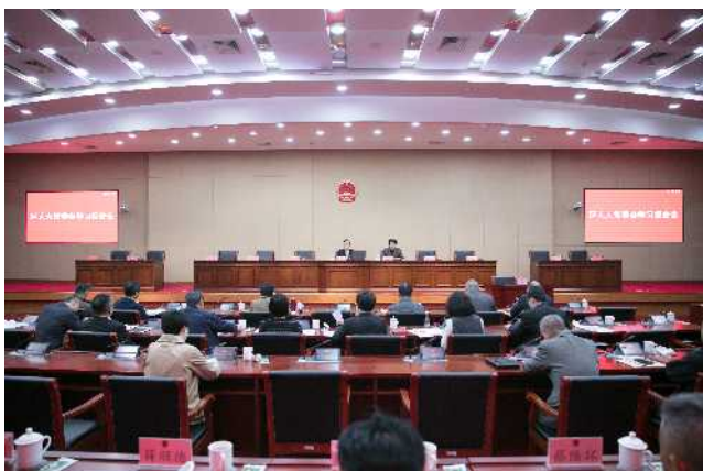
4月1日下午，区人大常委会举行学习报告会，邀请全国人大代表李丰传达十四届全国人大四次会议精神，并结合自己的参会经历交流感想和体会