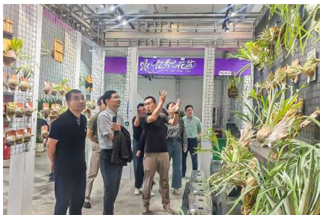
5月29日上午，区人大机关党支部开展“花谷蝶变看振兴，实干担当促发展”主题党日活动