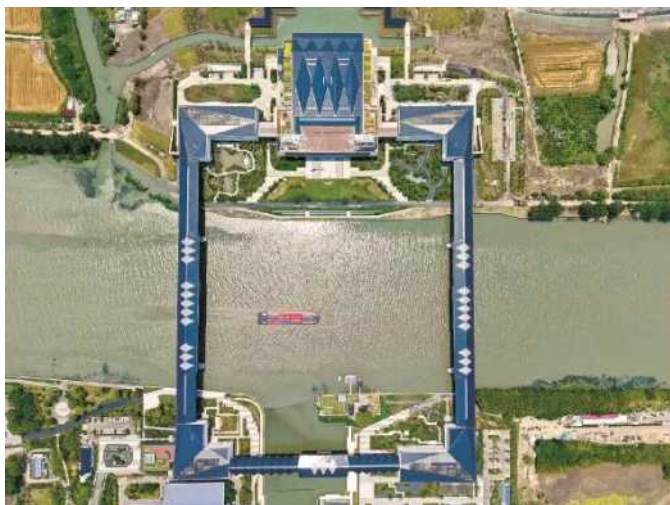
沪苏浙三地交界处，俯瞰三桥相连的方厅水院

长三角一体化发展，不仅是国家战略蓝图上的宏大叙事，更关乎长三角人的烟火日常，而最动人的笔触，落在“民生”二字上。是跨域出行如“串门”的便捷、是家门口就有好医生的暖心、是“进一扇门、办四地事”的从容……从“硬联通”到“软衔接”，在这片35.8万平方公里的土地上，多少曾经隔省相望的“盆景”，已悄然成为触手可及的“风景”。