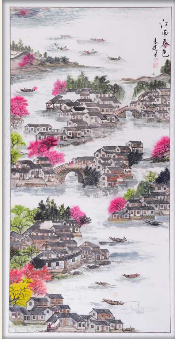
庆祝全国人民代表大会成立70周年书画展作品 江南春色 / 老年大学 朱建芳