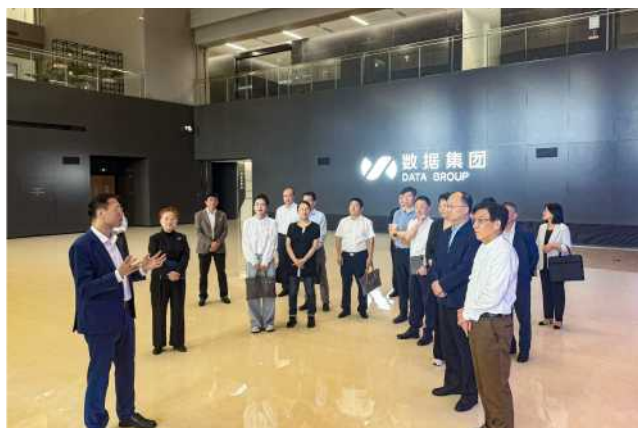
5月27日上午，市人大代表青浦小组赴上海数据集团开展专题调研