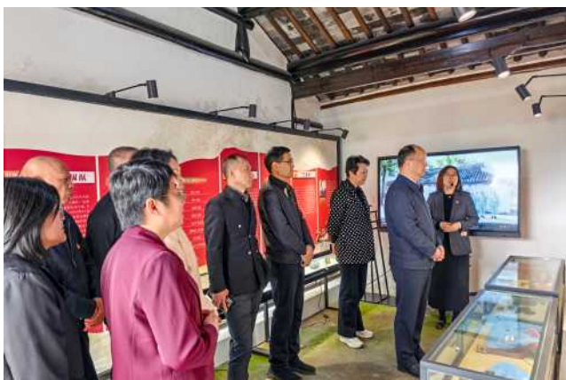
4月20日下午，区人大机关党支部开展“缅怀先烈守初心，砥砺奋进担使命”主题党日活动